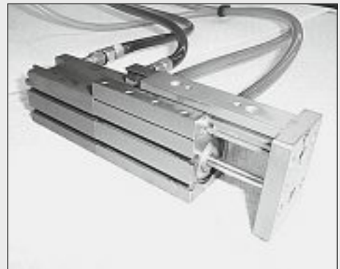
Linearantrieb mit verdoppelter Schubkraft und den selben Abmessungen wie das Standardmodell