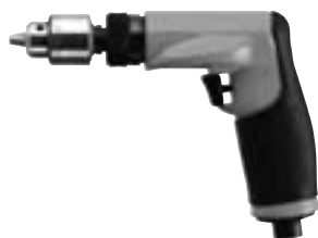
Modelle 14CFS91-38NL 14CFS93-38NL 14CSL97-51 14CNL91-51 14CNL92-51