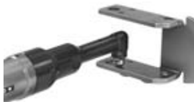
Modell 15SF287-72 beim Senken einer Bohrung mit einem Hartmetall-Kegelsenker X053-0145-00 (siehe Seite 19)