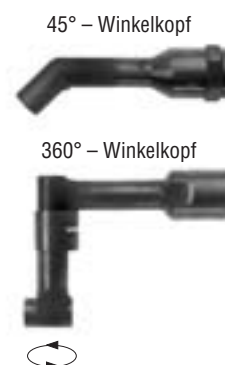
Weitere lieferbare Winkelkopfbauformen für die Modelle der Serie 15SF2...