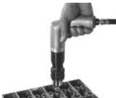
Modell 14CSL97-51 beim Senken und Entgraten eines Gußwerkstückes

1) = mit Planetengetriebeuntersetzung Maschinen mit anderen Drehzahlen auf Anfrage